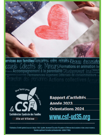
Validation des rapports d'activités et financiers 2023 Ainsi que des orientations et budget prévisionnel 2024