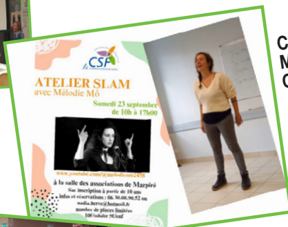
CSF Marpiré Champeaux