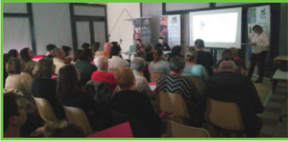
58 participants, 16 associations

l'Assemblée Générale départementale du jeudi 11 avril 2024 à Marpiré