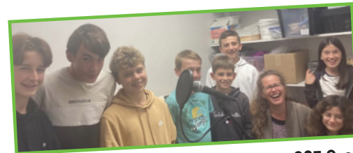
Slam « Anxiété sociale » à l'accueil jeunes CSF Ossé