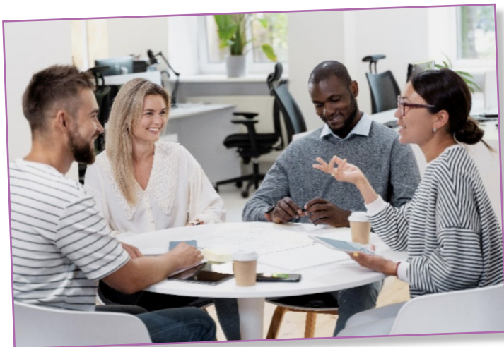
Les différentes instances... Mais de quoi parle-t-on ?

La CSF UD 35 est présente, tout au long de l'année, au sein des différentes instances des bailleurs sociaux. Les bénévoles des associations locales représentent les locataires de Fougères Habitat (Fougères), Espacil Habitat (Rennes), Archipel Habitat (Rennes) et La Rance (Saint-Malo, Dinard).