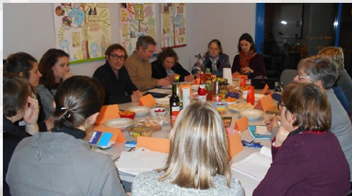
Rencontre des Espaces de Vie Sociale de la CSF