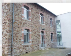
A l'extérieur la pierre se mélange à l'agrandissement