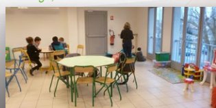
A l'étage, la salle d'activités des + 6 ans