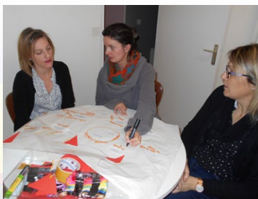
Commission projet d'été