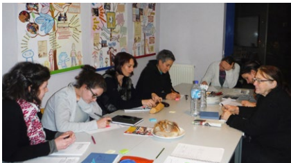
Commission pédagogique départementale : préparation de la journée départementale des pédagogies