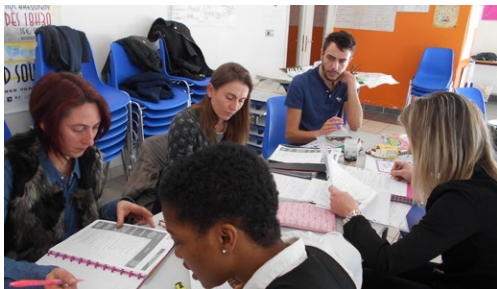
Formation au Brevet d'Aptitudes aux Fonctions de Directeurs