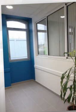
En bas, le bureau de la directrice donnant sur un hall d'accueil