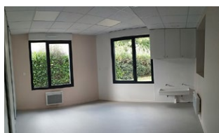
Et une nouvelle salle d'activités