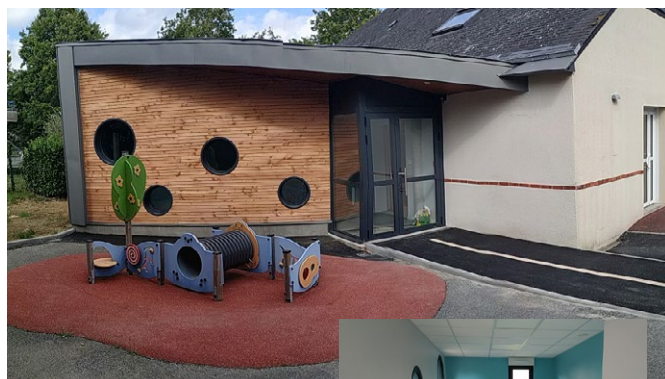
Une nouvelle entrée